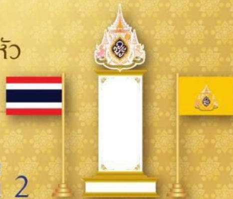
รูปแบบที่ 2

ตั้งโต๊ะหมู่ประดิษฐาน พระฉายาลักษณ์สมเด็จพระเจ้าอยู่หัว พร้อมเครื่องราชสักการะ