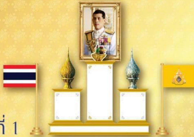
รูปแบบที่ 1

ตั้งโต๊ะหมู่ประดิษฐาน พระฉายาลักษณ์สมเด็จพระเจ้าอยู่หัว พร้อมเครื่องราชสักการะ